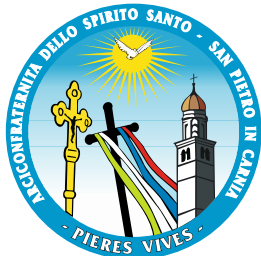
Arciconfraternita dello Spirito Santo Piere Vives - Zuglio Carnico (UD)